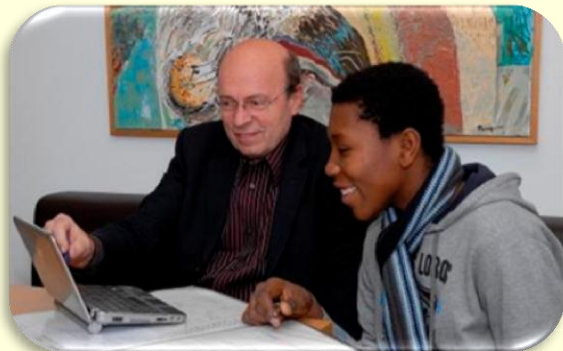
Coaching bei der Nachbarschaftshilfe Taufkirchen