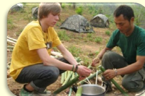
Schüleraustausch in Indien